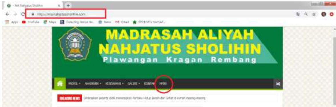
Tampilan pada PC / Komputer